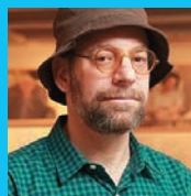
著者 / アンドルー・ジョージ

ロサンゼルス在住の写真家。2011年THE WORLDWIDE GALA PHOTOGRAPHY AWARDSなどのタイトルを受賞し、The Huffington Post, CBS News, The Chicago Tribuneをはじめとする多くのメディアで紹介される。プロジェクトに「Secondhand Nature」「Light Leaks」「Everything Reminds Me of Everything」など多数。世界20カ国以上の展覧会開催の実績を持つ。