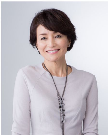
仁科 亜季子 女優

1985年東京大学医学部卒業。国立感染症研究所、東京大学医科学研究所、国際医療福祉大学での職務を経て現在、日本医科大学特任教授。2023年6月より第7代日本尊厳死協会理事長。