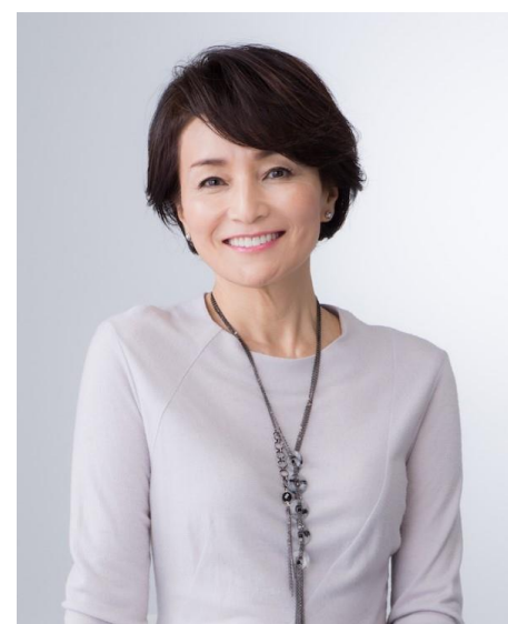
仁科 亜季子 女優

1960年生まれ。85年東京大学医学部卒業。国立感染症研究所、東京大学医科学研究所、国際医療福祉大学での職務を経て現在、日本医科大学特任教授。2023年6月より第7代日本尊厳死協会理事長。